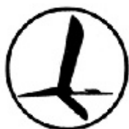
1930 Tadeusz Gronowski Logo LOT