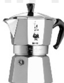
Alfonso Bialetti 1930 Ekspres Moka